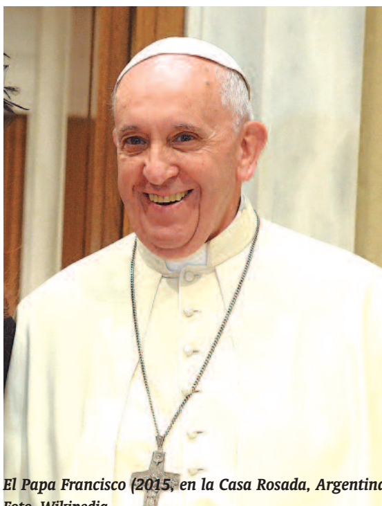
El Papa Francisco (2015, en la Casa Rosada, Argentina)