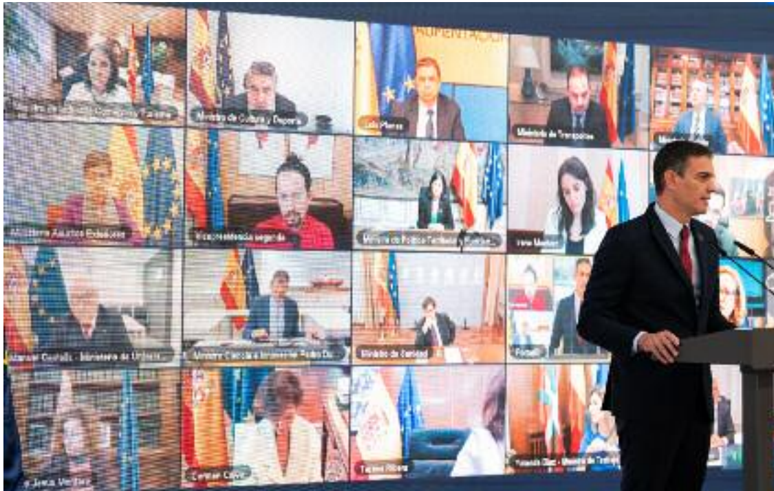
Pool Moncloa/Borja Puig de la Bellacasa