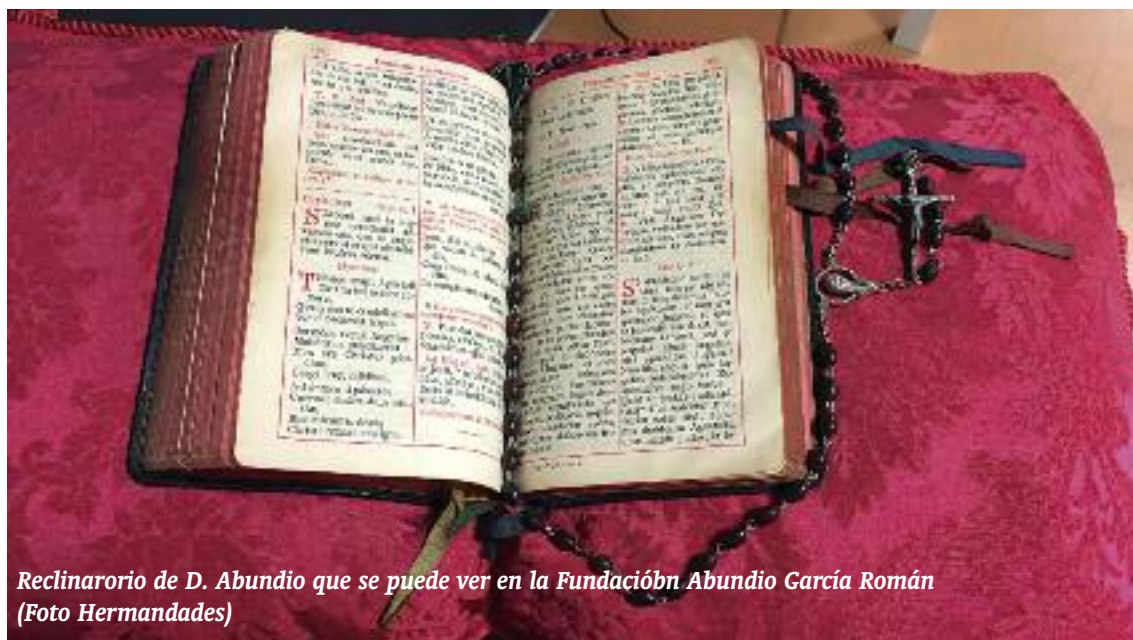
Reclinatorio de D. Abundio que se puede ver en la Fundaci6n Abundio Garc3a Rom3n

“Meditaci6n espiritual,” “contemplaci6n,” “lectura divina,” “examen de conciencia,” “oraci6n mental,” son t6rminos que se solapan y que significan en el fondo ponerse delante de nuestro Dios omnipotente con el Esp3ritu de Cristo.