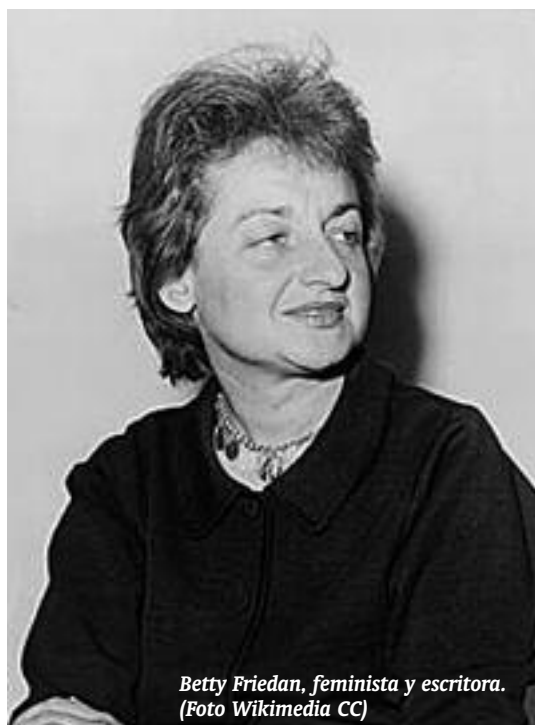
Betty Friedan, feminista y escritora.

Los tres libros mencionados son tres hitos en la evolución del feminismo. Escritos por tres mujeres, una francesa, una española y una alemana, contribuyeron de manera fundamental