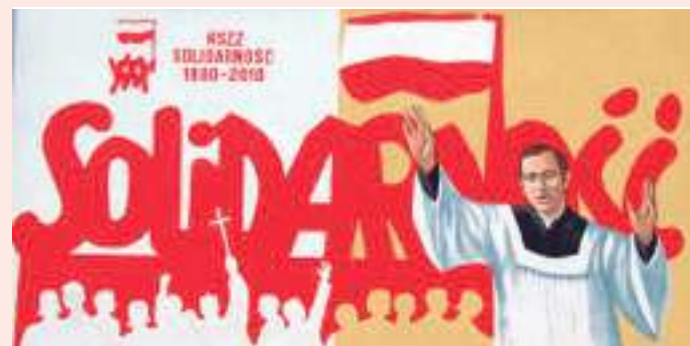
Mural conmemorando los 40 años de Solidranosc, con Popieluszko en la parte derecha.

sitor polaco Andrzej Panufnik (1914-1991) en memoria de Popieluszko. Concierto también lo podréis encontrar en el canal YouTube.