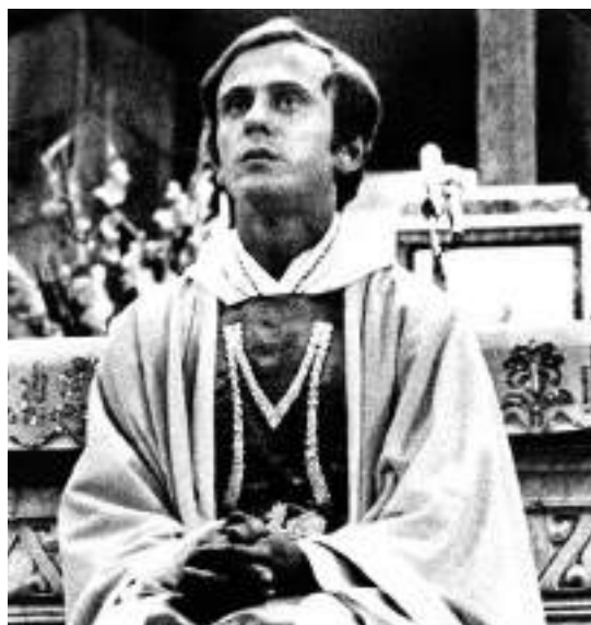
Beato Jerzy Popiełuszko (1947-1984) sacerdote católico polaco.

Beato Jerzy Popiełuszko, ayuda a las Hermandades del Trabajo de España y América en nuestro anhelo de progreso y justicia para el mundo del trabajo.