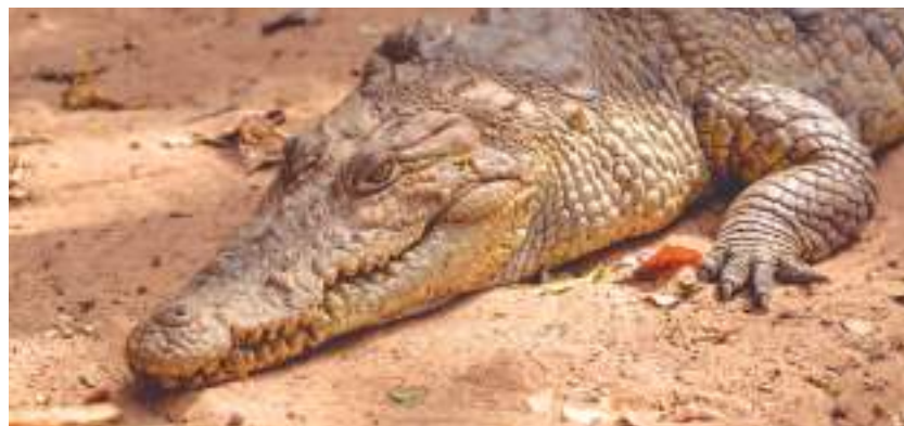
El cocodrilo es uno de los animales mencionados en la Biblia.

Esto me da pie para traer a este espacio algunos animales de la Biblia. No es la primera vez, ya que de algunos de ellos ya hemos hablado aquí, como la serpiente del paraíso o los dragones. Un texto poblado de animales lo encontramos en el pasaje que se ocupa de los animales puros e impuros del libro del Levítico. Allí se mencionan «el camello [...] el conejo [...] la liebre [...] el cerdo [...] el águila, el quebrantahuesos, el águila marina, el buitro, el halcón [...] el cuervo [...] el avestruz, la lechuza, la gaviota, el gavilán [...] el búho, el somormujo, el ibis, el cisne, el pelícano, el calamón, la cigüeña, la garza [...] la abubilla, el murciélago [...] la langosta [...] [el] saltamontes, [las] caballetas y [los] grillos» (Lv 11,4-7.13-19.22).