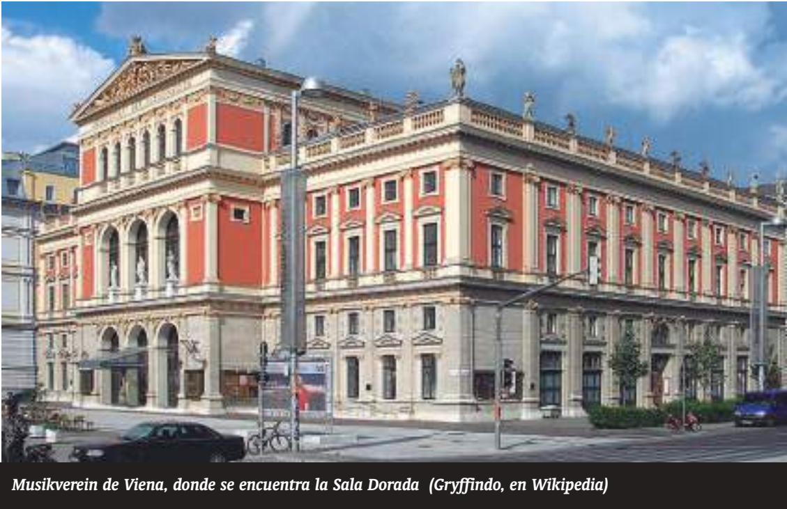
Musikverein de Viena, donde se encuentra la Sala Dorada