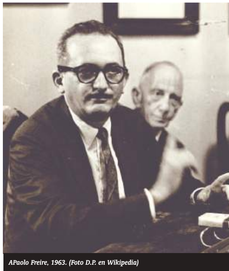
APaolo Freire, 1963.

Para Paulo Freire, el proceso de alfabetización tiene todos los ingredientes necesarios para la liberación: “... el aprendizaje y profundización de la propia palabra, la palabra de aquellos que no les es permitido expresarse, la palabra de los oprimidos que sólo a través de ella pueden liberarse y enfrentar críticamente el proceso dialéctico de su historización (ser persona en la historia)”. El sujeto, poco a poco, aprende a ser autor, testigo de su propia historia siendo capaz de escribir su propia vida, consciente de su existencia y de que es protagonista de la historia.